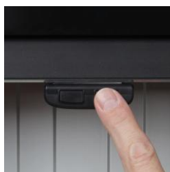
Télécommande de réglage de la hauteur