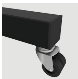
Support mobile à double roulette